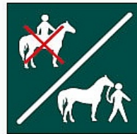
Zaldia oinez gidatzea Conducción pie a tierra