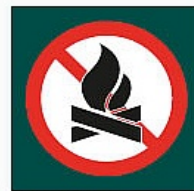
Debekatuta dago sua egitea Prohibido hacer fuego