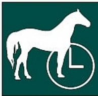
Zaldiak alokatzea Alquiler de caballos