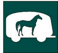
Zaldiak garraiatzea Transporte de caballos