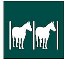
Ukui luak Cuadras