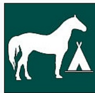
Kanpalekua Zona de acampada