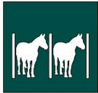
Ukui luak Cuadras