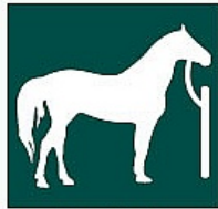
Kanpoaldean lotzeko puntua Punto de amarre exterior