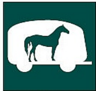
Zaldiak garraiatzea Transporte de caballos