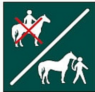
Zaldia oinez gidatzea Conducción pie a tierra