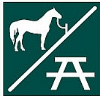
Aisiarako eremua Área recreativa