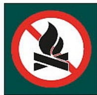
Debekatuta dago sua egitea Prohibido hacer fuego