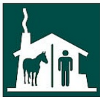
Zaldientzako ostataua Alojamiento ecuestre